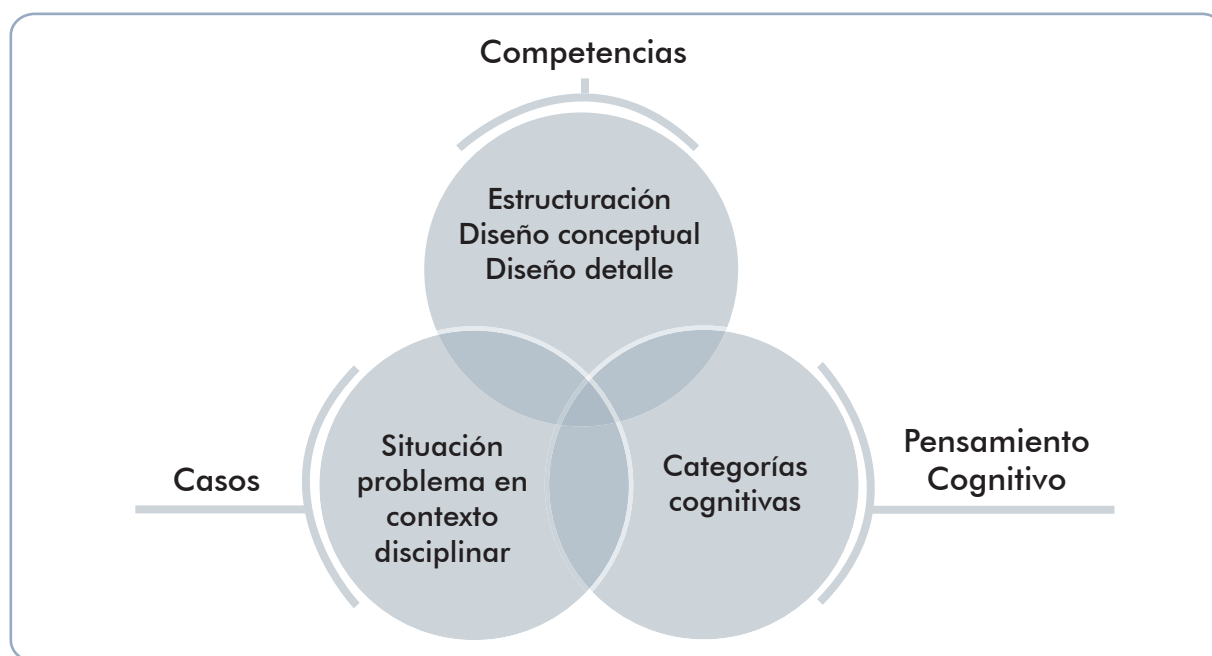
Ilustración 3. Componentes de la evaluación de diseño en ingeniería

Tres momentos se deben articular en el objeto de evaluación del dominio de diseño en ingeniería, presentados en la ilustración 3.