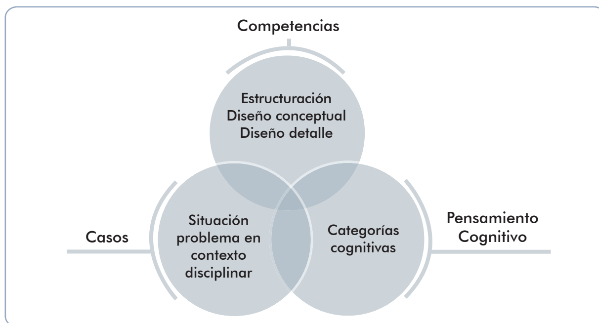
Ilustración 3. Componentes de la evaluación de diseño en ingeniería

Tres momentos se deben articular en el objeto de evaluación del dominio de diseño en ingeniería, presentados en la ilustración 3.