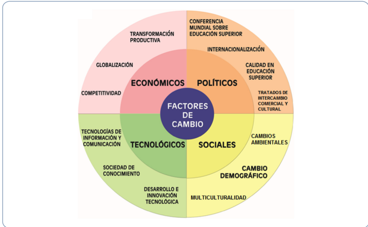
Ilustración 1. Factores que influyen en la formación de ingenieros